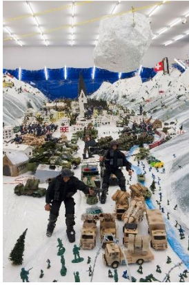
Thomas Hirschhorn (*1957), Wirtschaftslandschaft Davos , 2001 Verschiedene Materialien, 3000 x 1380 x 2267 cm Aargauer Kunsthaus Aarau / Aargauischer Kunstverein und Schweizerische Eidgenossenschaft, Bundesamt für Kultur, erworben mit zusätzlicher Unterstützung von Angelika und Josef Meier, der Freunde der Aargauischen Kunstsammlung sowie des Kulturfonds Mit Genehmigung des Künstlers © 2024, ProLitteris, Zürich