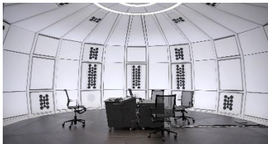
Gabriela Löffel (*1972), Grammar of calculated ambiguity , 2024 [Videostill] 1 Kanal-Video-Sound-Installation mit Ton