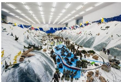
Thomas Hirschhorn (*1957), Wirtschaftslandschaft Davos , 2001 Verschiedene Materialien, 3000 x 1380 x 2267 cm Aargauer Kunsthaus Aarau / Aargauischer Kunstverein und Schweizerische Eidgenossenschaft, Bundesamt für Kultur, erworben mit zusätzlicher Unterstützung von Angelika und Josef Meier, der Freunde der Aargauischen Kunstsammlung sowie des Kulturfonds Mit Genehmigung des Künstlers © 2024, ProLitteris, Zürich