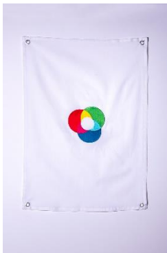
huber.huber (Markus Huber, *1975/Reto Huber, *1975), Friedensfahne , 2024 Baumwolle (OEKO-TEX) bestickt, Metallösen, 70 x 50 cm Mit Genehmigung der Künstler © huber.huber