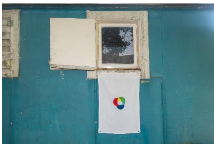
huber.huber (Markus Huber, *1975/Reto Huber, *1975), Friedensfahne , 2024 Baumwolle (OEKO-TEX) bestickt, Metallösen, 70 x 50 cm Mit Genehmigung der Künstler © huber.huber