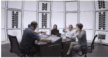
Gabriela Löffel (*1972), Grammar of calculated ambiguity , 2024 [Videostill] 1 Kanal-Video-Sound-Installation mit Ton