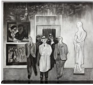
Marc Bauer (*1975), Sphinx , 1931, 1935/1947, 2014 Kohle auf Wand, Bleistift, Buntstift auf Papier, variabel Aargauer Kunsthaus Mit Genehmigung des Künstlers © Marc Bauer