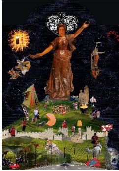
Guerreiro do Divino Amor (*1983), Le Miracle d'Helvetia , 2022 [Detail der Leuchttafel Desideria Patria , 100 x 70 x 10 cm] Mehrteilige Multimediainstallation, Masse variabel Coll. Fonds cantonal d'art contemporain, Genève Mit Genehmigung des Künstlers © Guerreiro do Divino Amor