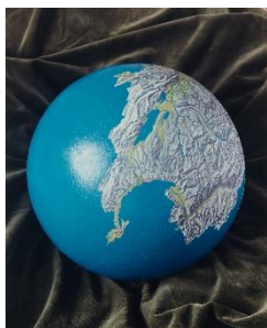
Guido Nussbaum (*1948), Schweizer Welt 1 , 1995 Analog-Fotografie, 60 × 50 cm Aargauer Kunsthaus Mit Genehmigung des Künstlers © Guido Nussbaum