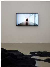
Installationsansicht Modell Neutralität 1.2.–11.5.2025, Aargauer Kunsthaus