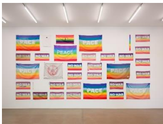
Installationsansicht Modell Neutralität 1.2.–11.5.2025, Aargauer Kunsthaus