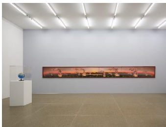
Installationsansicht Modell Neutralität 1.2.–11.5.2025, Aargauer Kunsthaut