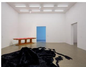
Installationsansicht Modell Neutralität 1.2.–11.5.2025, Aargauer Kunsthaus