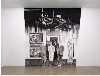
Installationsansicht Modell Neutralität 1.2.–11.5.2025, Aargauer Kunsthaus