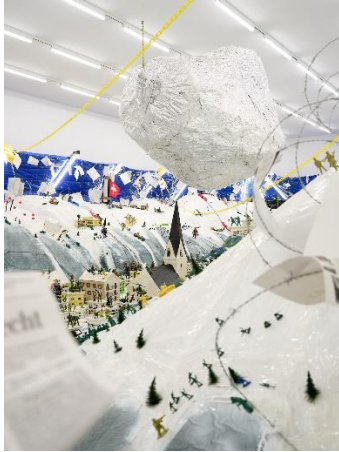
Installationsansicht Modell Neutralität 1.2.–11.5.2025, Aargauer Kunsthhaus