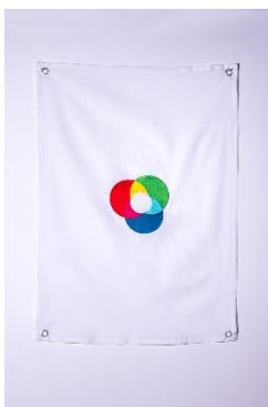
huber.huber (Markus Huber, *1975/Reto Huber, *1975), Friedensfahne , 2024 Baumwolle (OEKO-TEX) bestickt, Metallösen, 70 x 50 cm