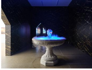
Installationsansicht Modell Neutralität 1.2.–11.5.2025, Aargauer Kunsthhaus