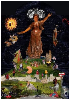
Guerreiro do Divino Amor (*1983), Le Miracle d'Helvetia , 2022 [Detail der Leuchttafel Desideria Patria , 100 x 70 x 10 cm] Mehrteilige Multimediainstallation, Masse variabel Coll. Fonds cantonal d'art contemporain, Genève Mit Genehmigung des Künstlers © Guerreiro do Divino Amor