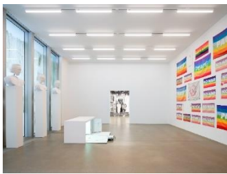
Installationsansicht Modell Neutralität 1.2.–11.5.2025, Aargauer Kunsthaus