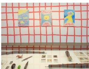
Installationsansicht Modell Neutralität 1.2.–11.5.2025, Aargauer Kunsthhaus