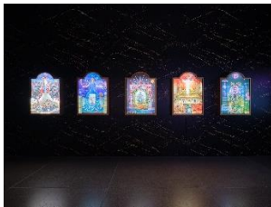
Installationsansicht Modell Neutralität 1.2.–11.5.2025, Aargauer Kunsthaus