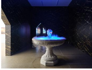
Installationsansicht Modell Neutralität 1.2.–11.5.2025, Aargauer Kunsthaus