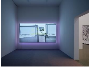
Installationsansicht Modell Neutralität 1.2.–11.5.2025, Aargauer Kunsthaus