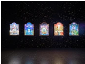
Installationsansicht Modell Neutralität 1.2.–11.5.2025, Aargauer Kunsthhaus