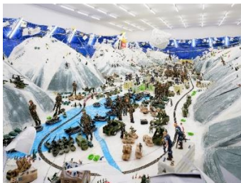
Installationsansicht Modell Neutralität 1.2.–11.5.2025, Aargauer Kunsthhaus