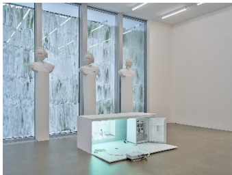
Installationsansicht Modell Neutralität 1.2.–11.5.2025, Aargauer Kunsthhaus