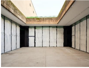
Installationsansicht Modell Neutralität 1.2.–11.5.2025, Aargauer Kunsthhaus