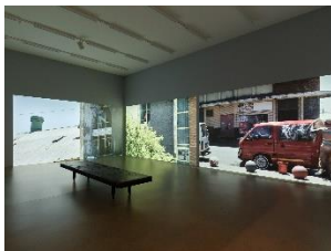
Installationsansicht Modell Neutralität 1.2.–11.5.2025, Aargauer Kunsthaut