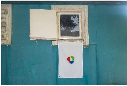
huber.huber (Markus Huber, *1975/Reto Huber, *1975), Friedensfahne , 2024 Baumwolle (OEKO-TEX) bestickt, Metallösen, 70 x 50 cm Mit Genehmigung der Künstler © huber.huber

Mit Genehmigung der Künstler © huber.huber