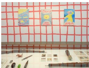
Installationsansicht Modell Neutralität 1.2.–11.5.2025, Aargauer Kunsthaus