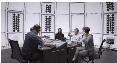
Gabriela Löffel (*1972), Grammar of calculated ambiguity , 2024 [Videostill] 1 Kanal-Video-Sound-Installation mit Ton Mit Genehmigung der Künstlerin © Gabriela Löffel