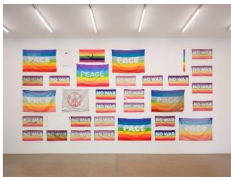
Installationsansicht Modell Neutralität 1.2.–11.5.2025, Aargauer Kunsthaus