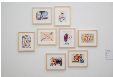
Ausstellungsansicht Miteinander nebeneinander Die 1970er und Aarau 12.6.–6.9.2026, Aargauer Kunsthaus