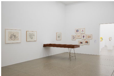
Ausstellungsansicht Miteinander nebeneinander Die 1970er und Aarau 12.6.–6.9.2026, Aargauer Kunsthaus