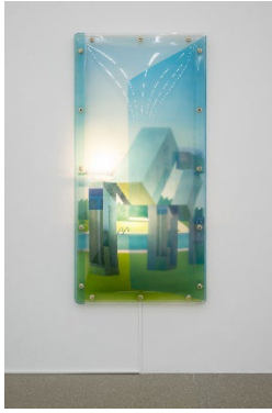
Ausstellungsansicht Miteinander nebeneinander Die 1970er und Aarau 12.6.–6.9.2026, Aargauer Kunsthaus Max Matter, Isaak Witkin, 1970