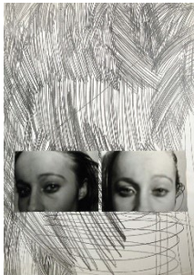
Klaudia Schifferle (*1955), Ohne Titel , 1974 Fotografie, Bleistift auf Papier, 42 x 29.7 cm Mit Genehmigung der Künstlerin © 2026, ProLitteris, Zürich