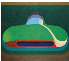
Markus Müller (*1943), Bolide , 1968 Öl auf Leinwand, 160 x 180 cm Aargauer Kunsthaus / Schenkung aus Nachlass Robert Beeli, 2007 © Markus Müller