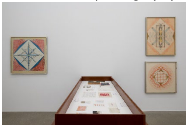
Ausstellungsansicht Miteinander nebeneinander Die 1970er und Aarau 12.6.–6.9.2026, Aargauer Kunsthaus