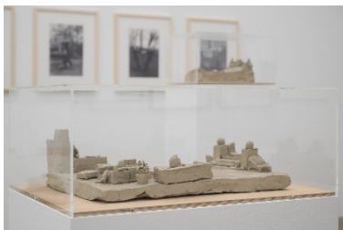
Ausstellungsansicht Miteinander nebeneinander Die 1970er und Aarau 12.6.–6.9.2026, Aargauer Kunsthaus