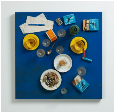
Daniel Spoerri (1930-2024), Tableau piège, 1972 Assemblage, 70 x 70 x 35 cm Aargauer Kunsthau / Ankauf, 2017 Mit Genehmigung des Künstlers