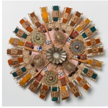
Doris Stauffer (1934 – 2017), Grossmutter , 1961<br> Diverse Materialien, 8 x 40 x 40 cm<br> Aargauer Kunsthaus / Ankauf<br> © Nachlass Doris Stauffer<br> Foto: Timo Ullmann