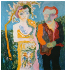
Paul Camenisch (1893 – 1970), Das Brautpaar (Oblomow und Oljga) , 1928<br> Öl auf Leinwand, 124 x 114 cm<br> Aargauer Kunsthaus / Schenkung Martha Camenisch, 1981<br> © Nachlass Paul Camenisch