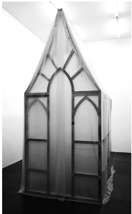
Skin City, 2026

oder Postern von Stars in Teenage-Zimmern blickt uns das Gesicht einer Frau entgegen. Es ist die libanesische Sängerin und Schauspielerin Haifa Wehbe, eine der erfolgreichsten arabischsprachigen Popstars der 2000er-Jahre. Sie hält einen Finger an ihre Lippen – eine Geste, die mit Unschuld, aber auch mit Diskretion oder der Geheimhaltung vertraulicher Informationen assoziiert wird und somit subversives Potenzial in sich trägt. Der Briefkasten mit seiner sich wiederholenden geometrischen Struktur und seiner bürokratischen, standardisierten Formensprache wird durch Schichten von Farbe und Make-up zum Symbol gesellschaftlicher Projektionen.