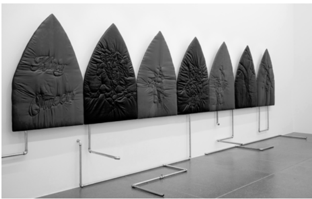
Unearth Angel I-VII, 2026 Pipelines, 2026