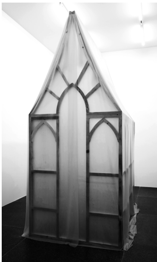
Skin City, 2026

ou les posters de stars dans les chambres des adolescents, le visage d'une femme nous regarde. Il s'agit de la chanteuse et actrice libanaise Haifa Wehbe, l'une des pop stars arabophones les plus célèbres des années 2000. Elle pose un doigt sur ses lèvres – un geste associé à l'innocence, mais aussi à la discrétion ou au secret maintenu sur des informations confidentielles, et portant ainsi en lui un potentiel subversif. La boîte aux lettres avec sa structure géométrique répétitive et son langage de design standardisé et bureaucratique devient, par le biais de couches de peinture et de maquillage, un symbole des projections sociales.