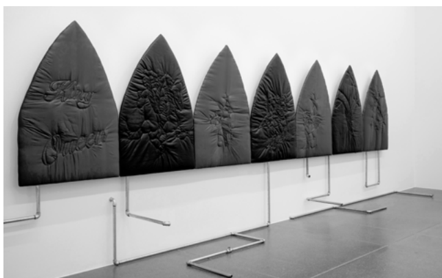
Unearth Angel I-VII, 2026 Pipelines, 2026